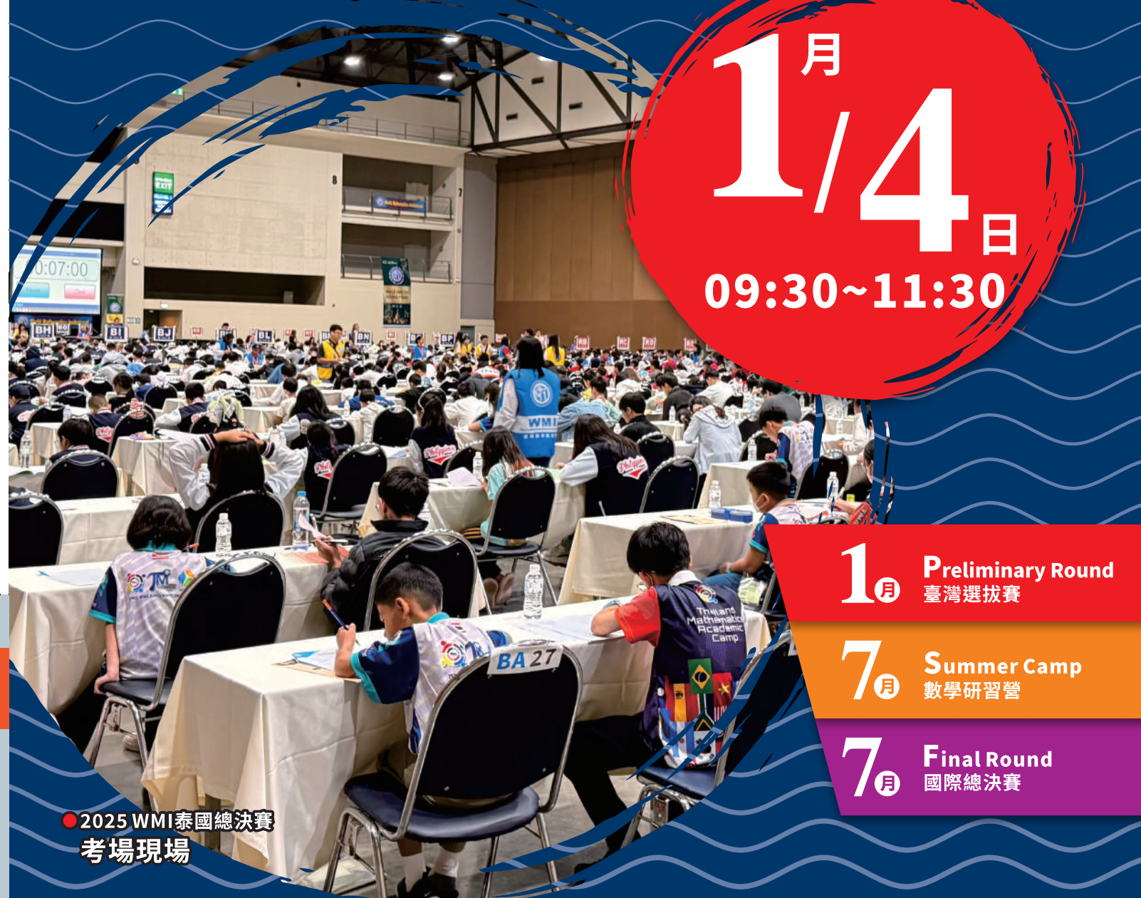
● 2025 WMI泰國總決賽 考場現場