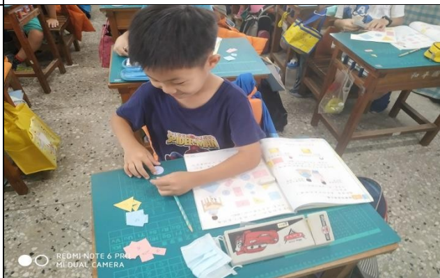
說明：比較面積大小