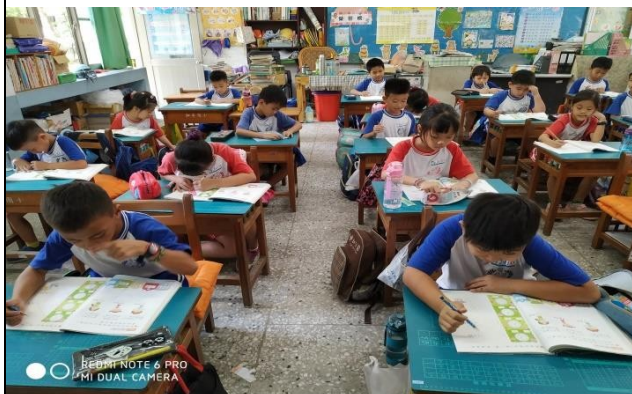
說明：動動腦寫習作