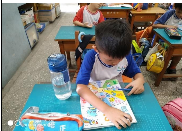
說明：實際用尺量課本長度