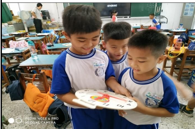
說明：小老師時鐘教學