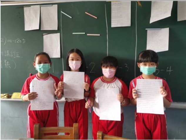
說明：進行英語硬體字比賽