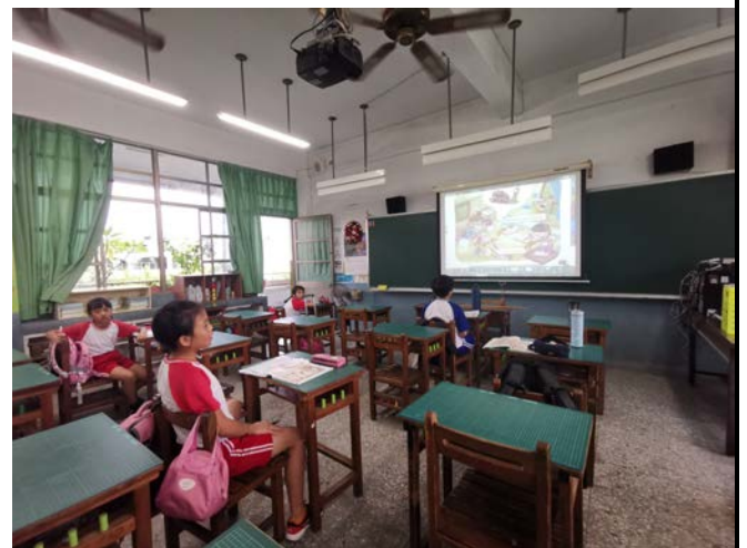
說明；差異化學生練習聽力及說讀