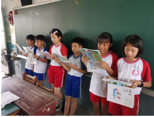
說明：進行英語讀者劇場教學及練習