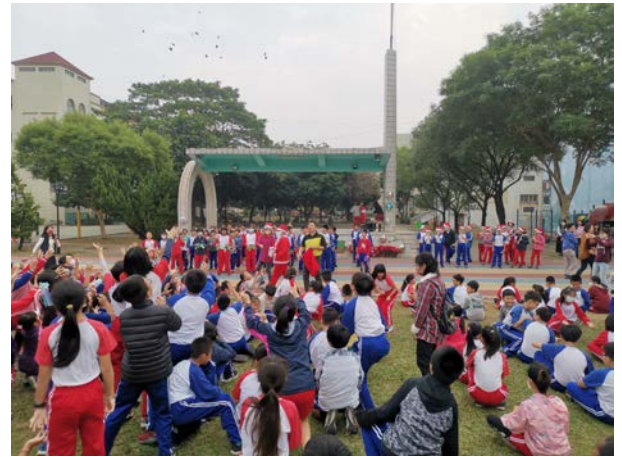
說明；配合聖誕節進行活動全校教學