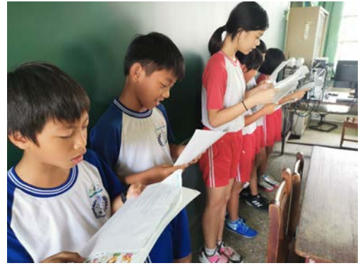
說明；進行英語讀者劇場教學及角色扮演