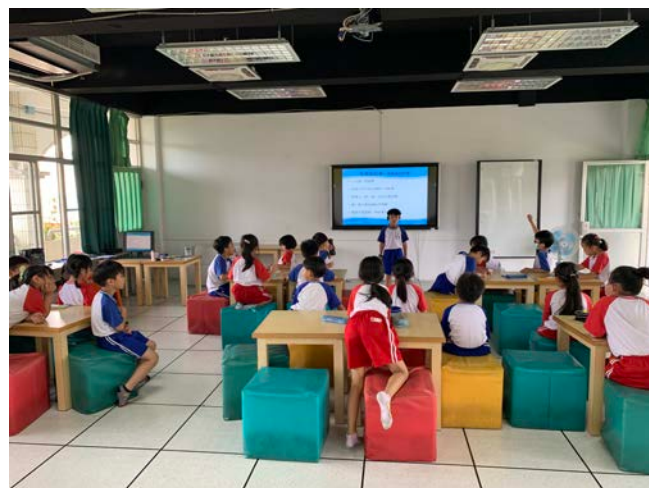
一年級學生專心看著同學分享自己編的故事