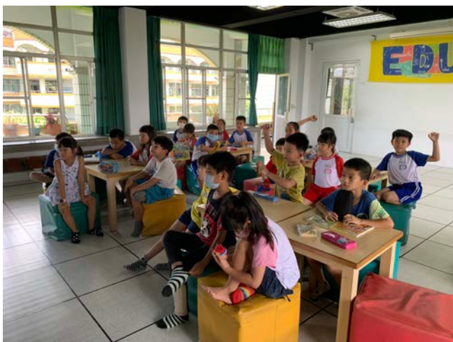
對於同學分享的故事有一些疑問所以舉手提問