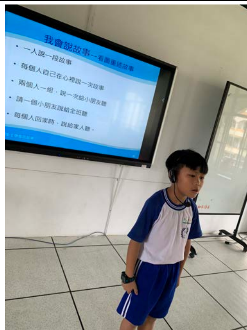
別擔心聲音不夠大可以戴上耳麥上台說故事