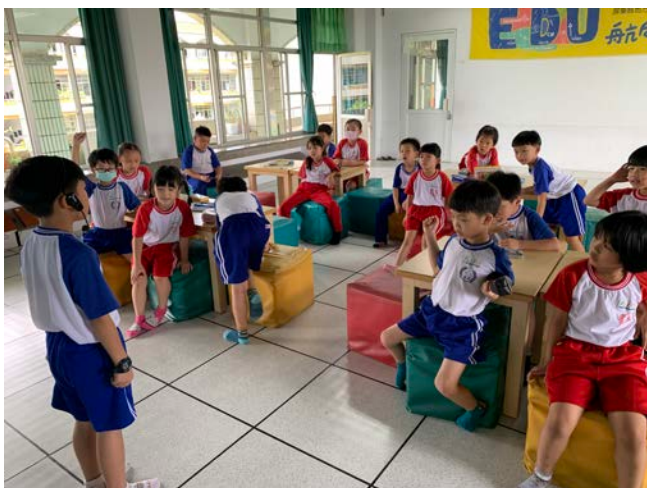
經過小組討論合編故事後鼓起勇氣上台