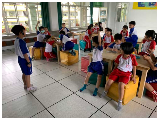
舉手發言的同學十分踴躍