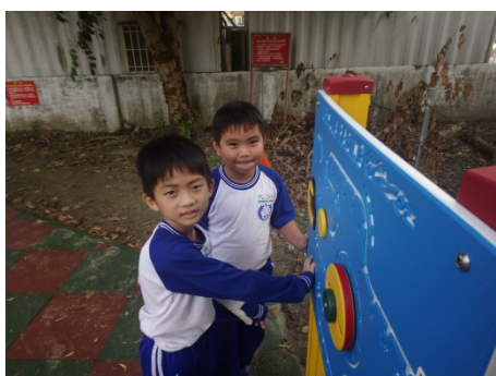
說明：遊戲場安全指導