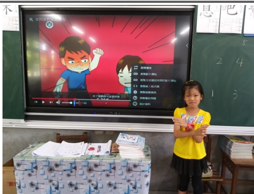
說明 1 說明：觀看影片內容