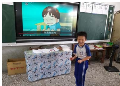
說明 2：邊看並提出疑問