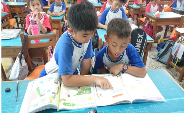
說明：同儕討論指導