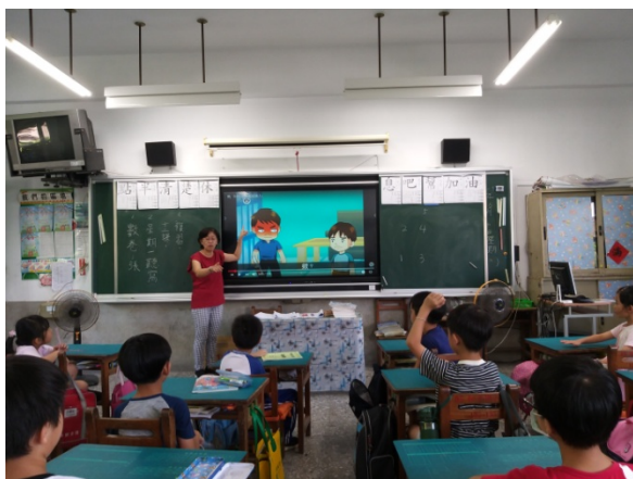
說明 3：分享影片與討論