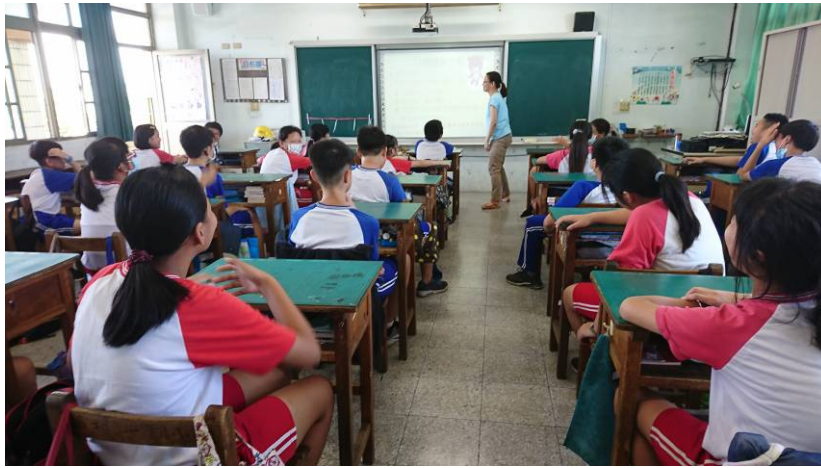
輔以電子白板影片教學，吸引同學注意力並提升學習能力