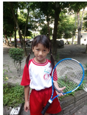
說明：迷你網球練習