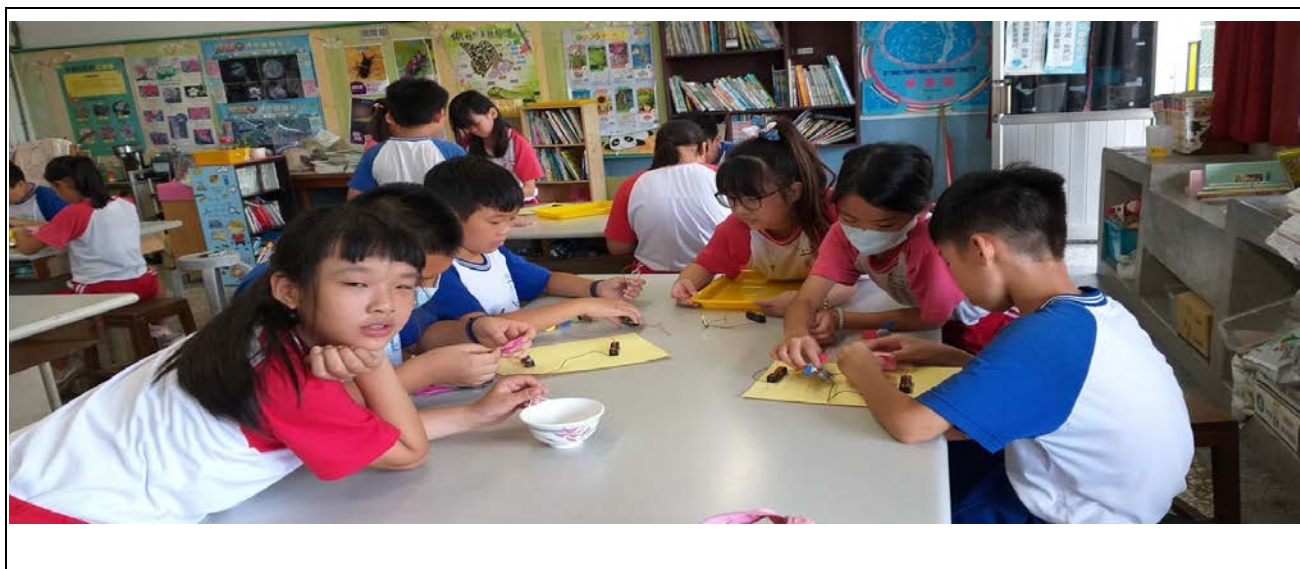
【108 上社會領域學習課程實施成效評鑑表】