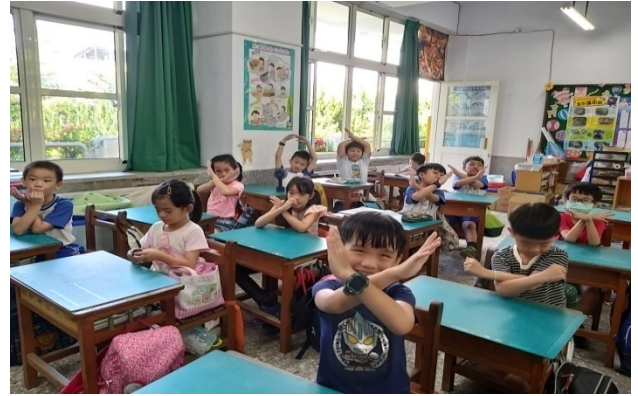
說明 5：熱烈討論之後