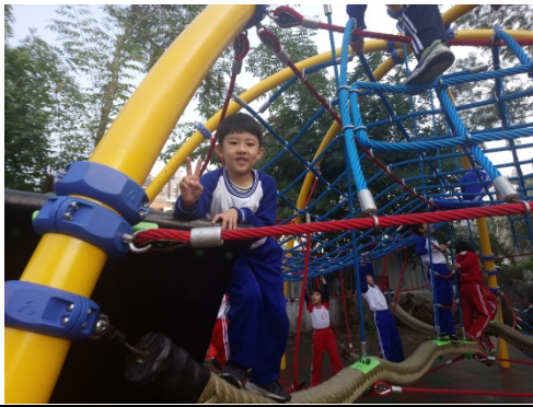
說明：遊戲場安全指導