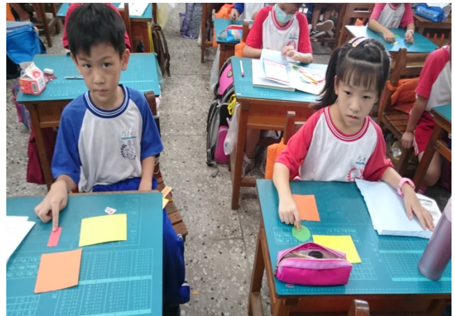
說明：互相觀摩對照