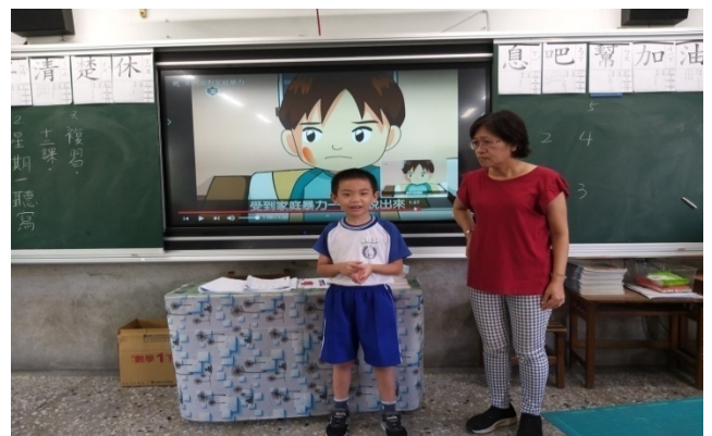
說明：4 看影片一起討論