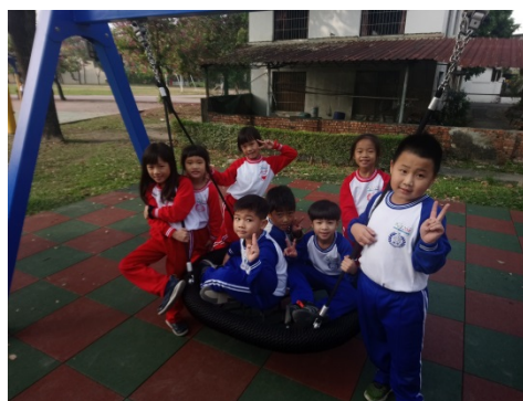
說明：遊戲場安全指導