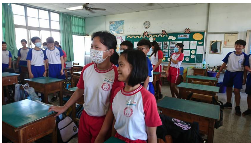
帶入活動，使課程更有趣